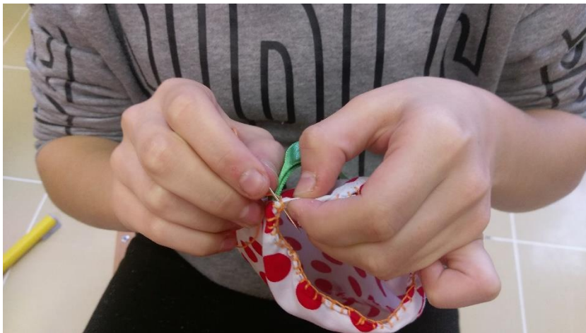
Slika 1 Šiviljska delavnica, ročno šivanje.