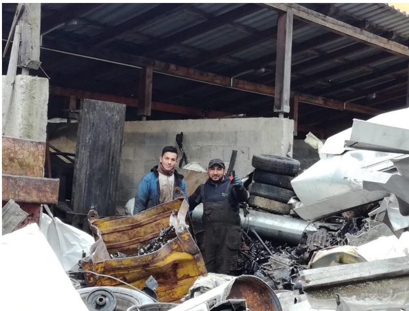
Slika 1 Praksa v domačem podjetju