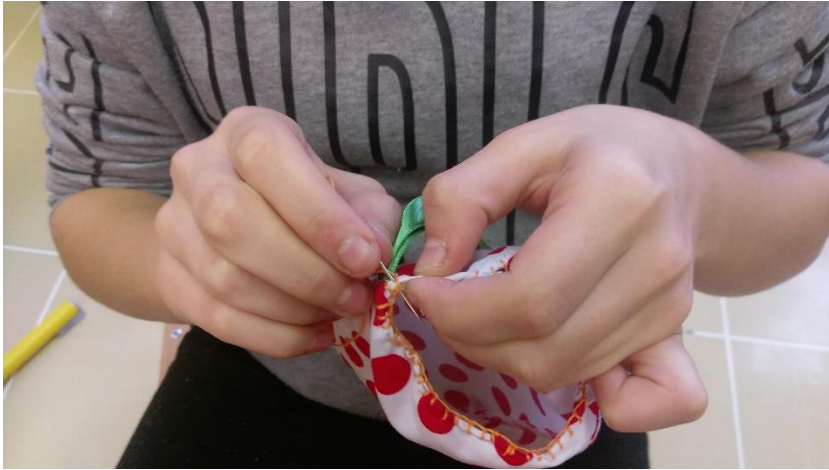
Slika 2 Šiviljska delavnica, ročno šivanje.