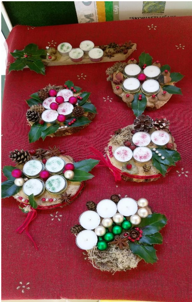
Slika 5 Božični venčki.