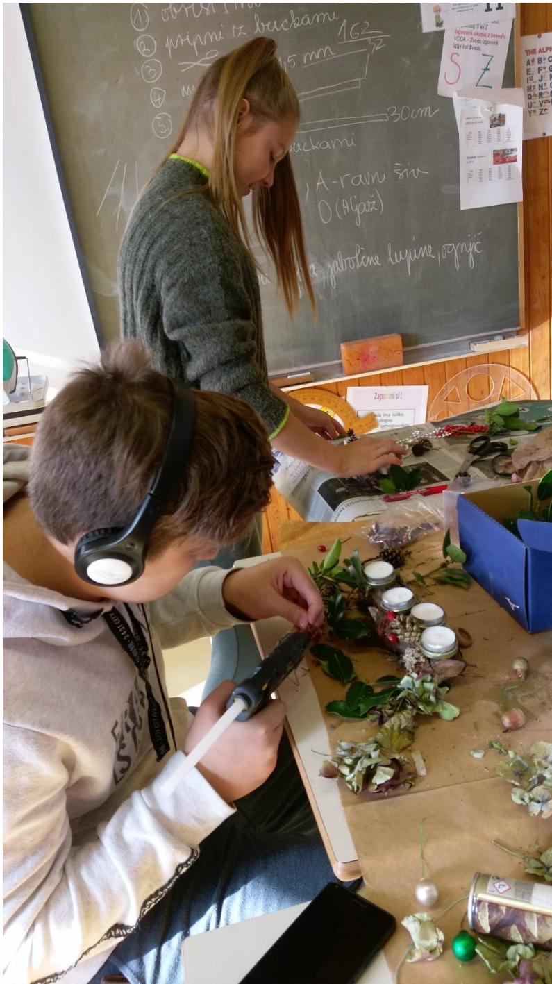
Slika 4 Izdelava božičnih venčkov.