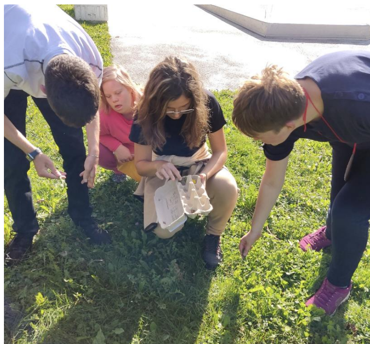
Po opravljenih nalogah smo vsi skupaj zapeli nekaj taborniških pesmi in se polni novit vtisov vrnili proti šoli.