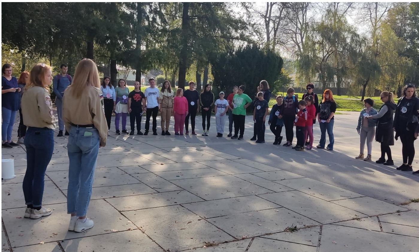
Nekateri učenci so skupaj z učiteljicami pripravili orientacijsko pot po Sončnem parku.